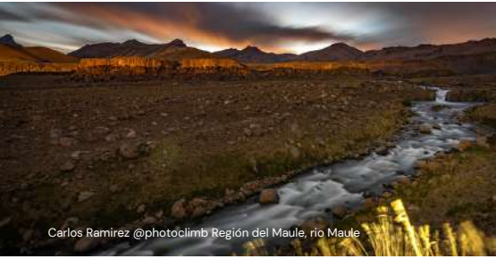
Carlos Ramirez @photoclimb Región del Maule, río Maule