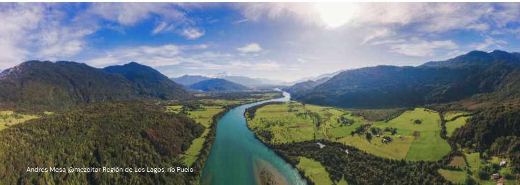
Andres Mesa @mezeitor Región de Los Lagos, río Puelo

Creación de una nueva categoría: "río protegido", que permita proteger sus altos valores socio-ecológicos: recreacionales, ecosistémicos, culturales, escénicos, espirituales, históricos, geológicos, entre otros, de forma permanente, contribuyendo a que fluyan libres y sanos y, con ello, al bienestar de quienes habitan en torno a ellos. Asimismo, que permita restaurar los ríos cuyos sus valores ambientales estén impactados.