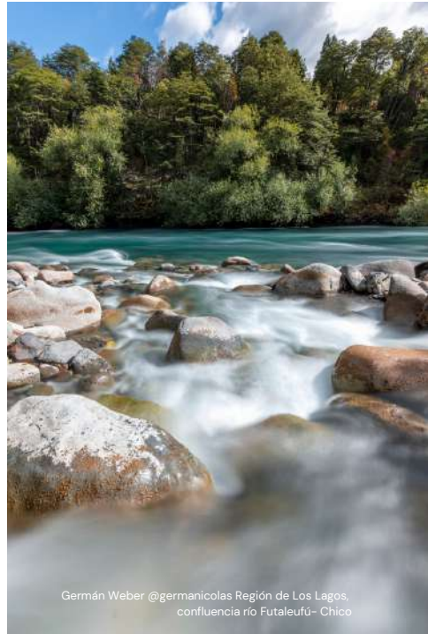
Germán Weber @germanicolos Región de Los Lagos, confluencia río Futaleufú- Chico

Fortalecimiento de la protección de cuerpos de agua dulce a través de la aplicación de las herramientas ya existentes, reconociendo sus brechas y posibles mejoras. Participando y apoyando casos de estudio, como por ejemplo las campañas para declarar los ríos Futaleufú y Puelo, protegidos mediante reservas de caudal.